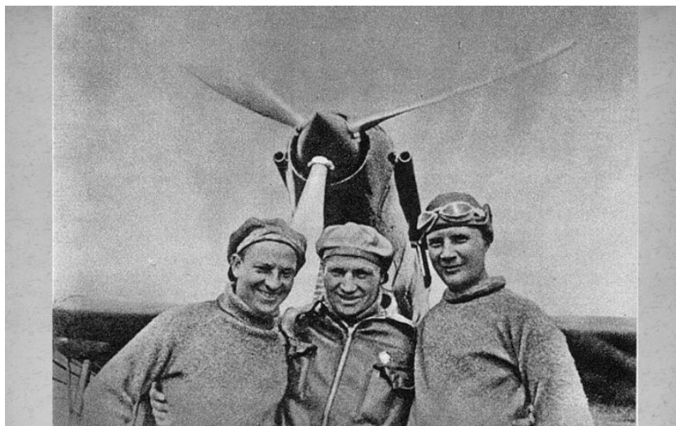
Экипаж самолета АНТ-25: В.П. Чкалов, Г.Ф. Байдуков, А.В. Беляков.

В июле 1936 году Байдуков, Чкалов и Беляков совершили беспосадочный перелет Москва - Петропавловск-Камчатский. Экипаж пробыл в воздухе 56 часов 37 минут и был награжден званиями Героев Советского Союза и орденами Ленина.